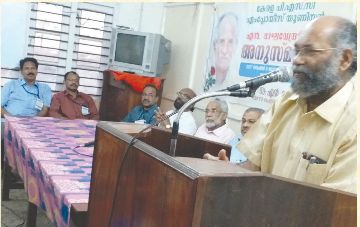
സ.എൻ.ആർ.പോറ്റി അനുസ്മരണം (തിരുവനന്തപുരം)-എൻ.രതീന്ദ്രൻ ഉദ്ഘാടനം ചെയ്യുന്നു